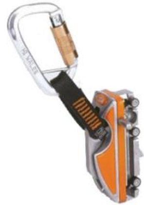
Söll Comfort UK